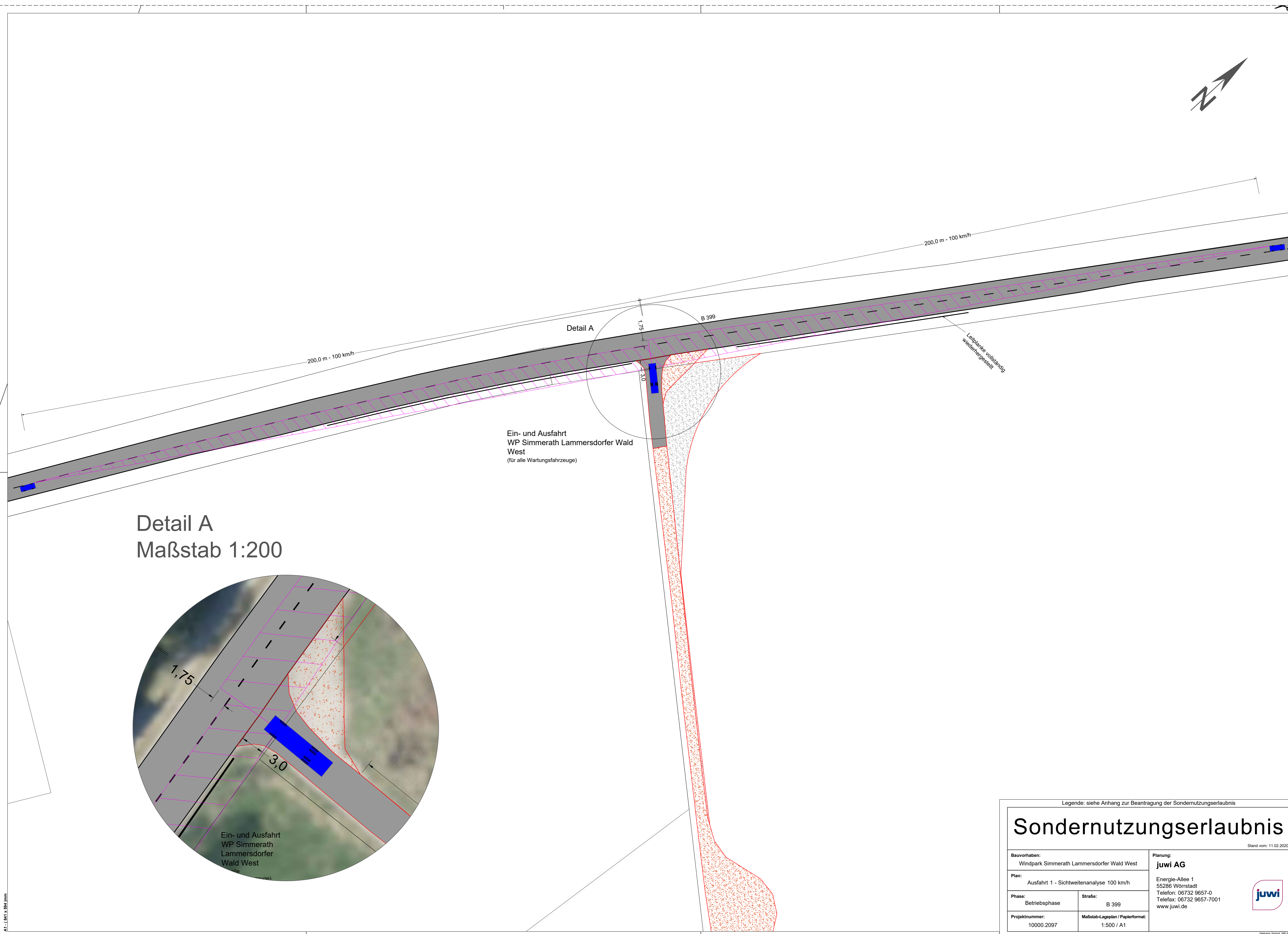
Detail A Maßstab 1:200